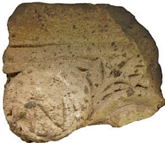
Сл. 5. Капител са монограмом цара Јустинијана I, Прва Јустинијана / Царичин град, VI век (према документацији Народног музеја Србије, инв. бр. 341/IV)