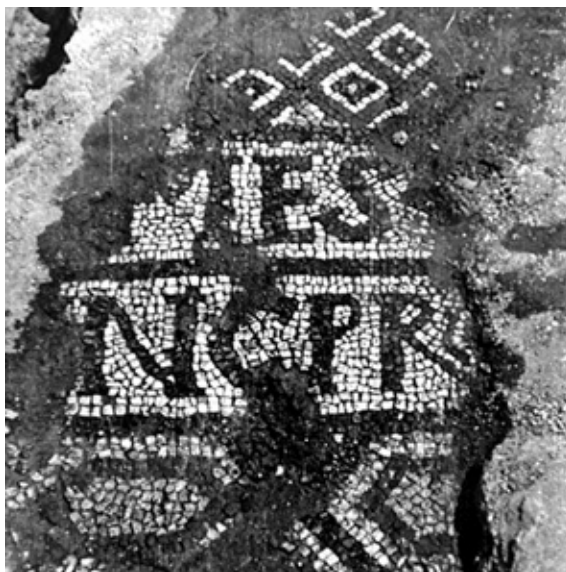
Сл. 3. Фрагмент подног мозаика из меморије на северној некрополи Улпијане

Подни мозаици са натписима откривени су и на северу централнобалканског простора, на локалитету Градиште код села Стојник на Космају. Реч је о оштећеном мозаичком тепиху откривеном на поду лонгитудиналне грађевине, која је била подељена на неколико мањих просторних јединица и на коју се ка истоку надовезивала