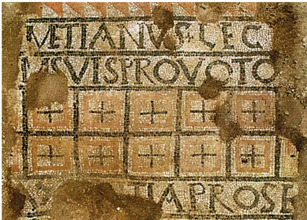
Сл. 2. Вотивни натпис са крстовима из тробродне базилике у Улпијани, IV век (према: СЕТИНКАЈА 2015: 115, ph. 7)

важна искључиво у контексту могућег учешћа војске у градитељским подухватима од јавног значаја. Инсистирање на дедикантовом рангу у војној хијерархији сведочи да је реч о имућном високо позиционираном појединцу, који је своју приватну побожност исказао тиме што је дао да се на проминентном месту у цркви изradi вотивни мозаик, представљајући се на тај начин као један од њених приложника и, попут ранијих евергета, остављајући залог за будућа поколења оних који су се у њој молили.